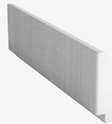
L-element S200, H400 borstad, FLEX