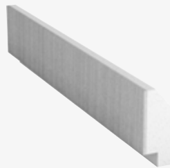
L-element S200, H300 borstad, FLEX